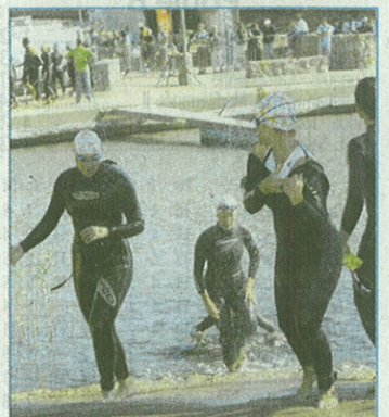
Sortie de l'eau et changement de tenue pour le vélo.